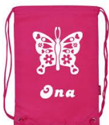
EJEMPLO DE MORRAL TIPO MOCHILA PEQUEÑA